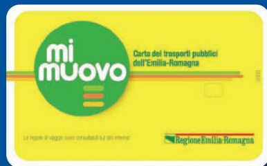
MI MUOVO CARD Abbonamenti mensili e annuali