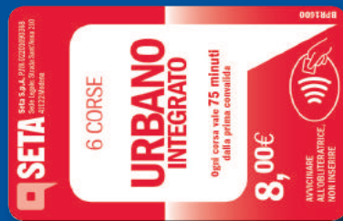
Biglietto multiplo orario 6 corse valido 75 minuti dalla convalida

L'abbonamento al servizio ferroviario regionale consente l'uso gratuito del servizio bus in area urbana