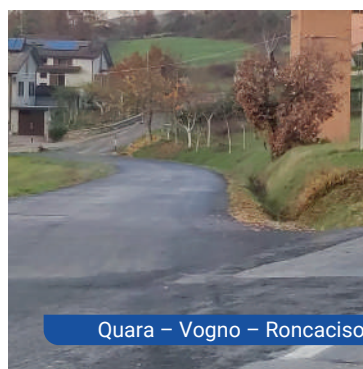
Quara - Vogno - Roncaciso