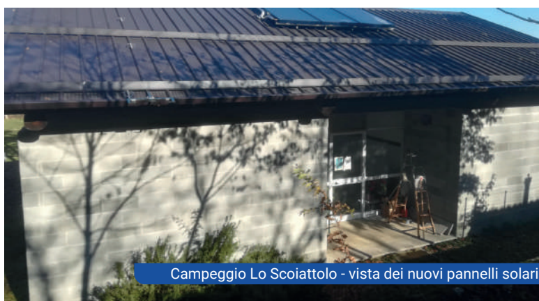
Campeggio Lo Scoiattolo - vista dei nuovi pannelli solari