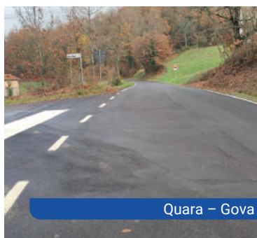
Quara - Gova