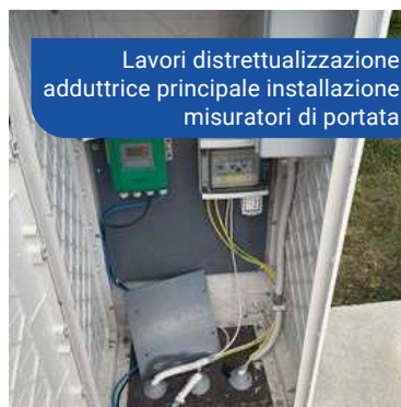
Lavori distrettualizzazione adduttrice principale installazione misuratori di portata

Per un importo di euro 20.000 verrà completata la distrettualizzazione della rete principale che consentirà di monitorare/misurare l'acqua all'ingrosso ceduta ad Ireti in comune di Villa Minozzo. Tali lavori saranno terminati in economica e beneficeranno di un contributo a fondo perduto del 50% con importo massimo di 10.000 euro tramite i fondi europei FSC.