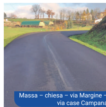
Massa - chiesa - via Margine - via case Campana