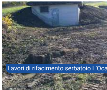
Lavori di rifacimento serbatoio L'Oca