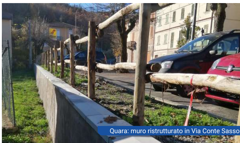
Quara: muro ristrutturato in Via Conte Sasso