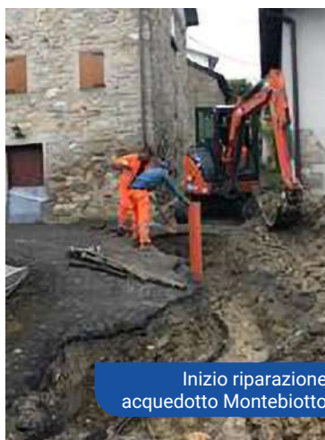
Inizio riparazione acquedotto Montebiotto

Rifacimento della rete di distribuzione dell'abitato di Montebiotto : verranno terminati i lavori di rifacimento della linea idrica dell'abitato di Montebiotto al fine di eliminare i problemi riscontrati nell'estate 2021. Costo stimato 15.000 euro complessivi. I lavori rientrano negli investimenti generali sull'acquedotto approvati da Atersir nella somma complessiva di euro 30.000.