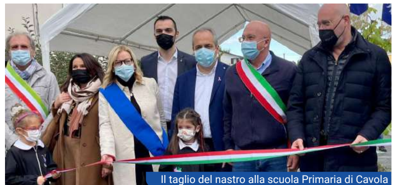
Il taglio del nastro alla scuola Primaria di Cavola