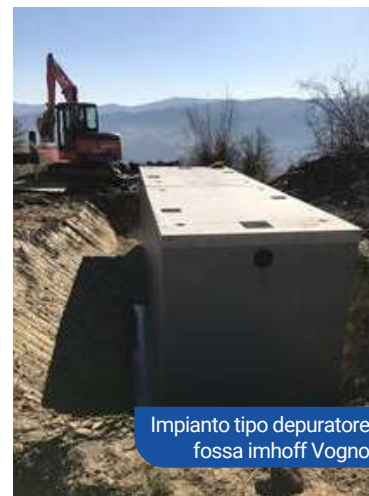
Impianto tipo depuratore fossa imhoff Vogno

Depuratore di Vogno : come previsto dal Piano d'Ambito verrà realizzato un impianto di depurazione di primo livello a servizio dell'abitato di Vogno per un costo stimato di euro 24.000;