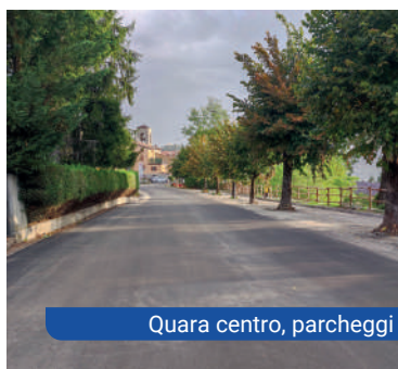
Quara centro, parcheggi