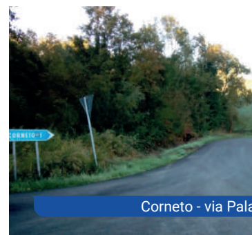
Corneto - via Pala