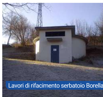
Lavori di rifacimento serbatoio Borella

È prevista inoltre la manutenzione straordinaria sui serbatoi di L'Oca e La Borella di Cerredolo : questi serbatoi verranno impermeabilizzati dopo aver eseguito lavori di manutenzione edile ed idraulica. I lavori verranno svolti dalla ditta Ruggeri di Parma , ditta specializzata nella impermeabilizzazione dei serbatoi. Costo stimato 14.000 euro complessivi. I lavori rientrano negli investimenti generali sull'acquedotto approvati da Atersir nella somma complessiva di euro 30.000.