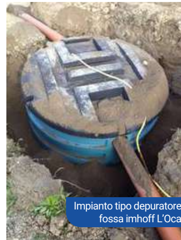
Impianto tipo depuratore fossa imhoff L'Oca

Depuratore di L'Oca : come previsto dal Piano d'Ambito verrà realizzato un impianto di depurazione di primo livello a servizio dell'abitato di L'Oca per un costo stimato di euro 13.000;