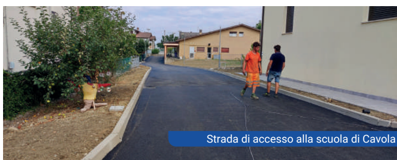
Strada di accesso alla scuola di Cavola