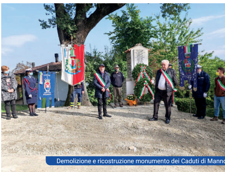
Demolizione e ricostruzione monumento dei Caduti di Manno

Frane: • Ponte di L'Oca verso il paese • Tratto centrale Montechiodo - Manno • Toano - Manno • Massa - Vecchieda • via Salvarana