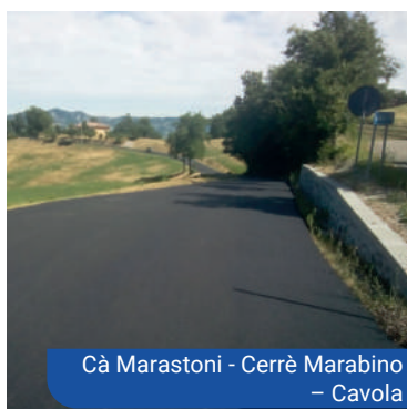
Cà Marastoni - Cerrè Marabino - Cavola