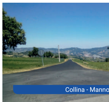
Collina - Manno