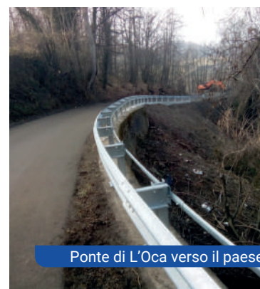
Ponte di L'Oca verso il paese

Frane: • Ponte di L'Oca verso il paese • Tratto centrale Montechiodo - Manno • Toano - Manno • Massa - Vecchieda • via Salvarana